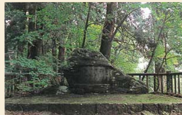
▲病翁碑(悠久山・蒼柴神社)